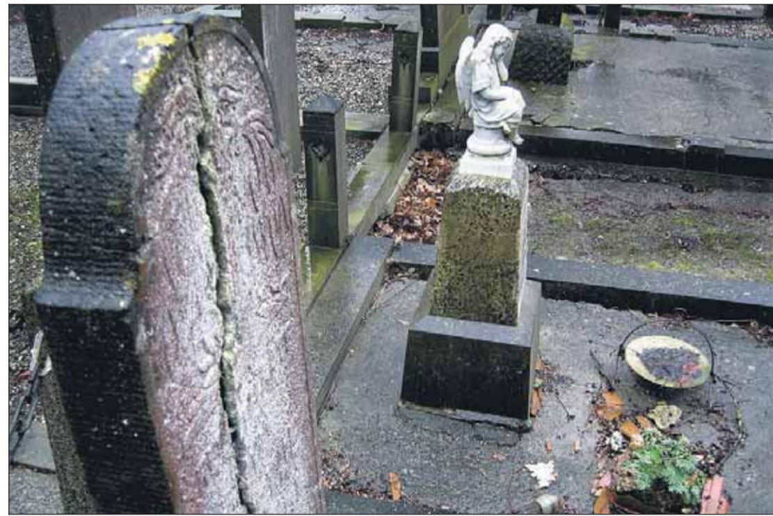
Verwaarloosde, vervallen en soms onherstelbare graven aan de Dalweg 36.

De verwaarloosde grafmonumenten stammen uit de periode 1919 tot 1972. De Vries: "Doordat er geen tot weinig onderhoud is gepleegd, zijn zerkken gaan scheuren en letters vervaagd. Dat is voor ons